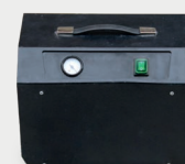
Pompe à vide pour le maintien des rails